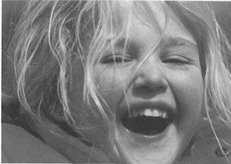
Os nenos ben alimentados están...